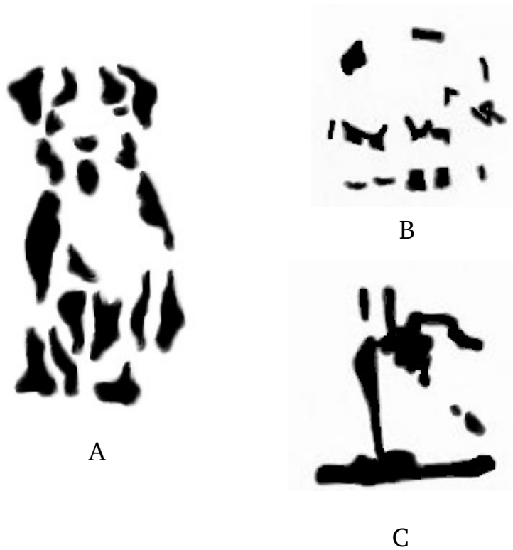
Figura 5.1. figuras incompletas.

También es más fácil percibir lo familiar que percibir lo que no lo es. Estudie la figura 5.1 hasta que haya identificado los tres elementos.